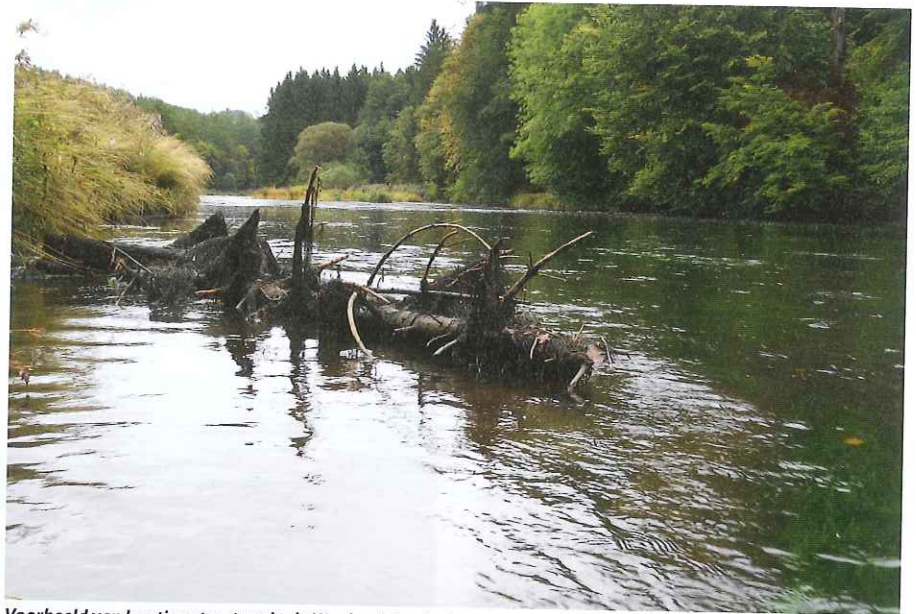
Voorbeeld van houtige structuur in de Waalse rivier de Semois. Dergelijke structuren dragen bij aan heterogeniteit van habitat.

E en geschikte habitat is essentieel voor het voltooien van de levenscyclus van vissen. Structuren in het water creëren van nature veel habitat. Voor veel soorten vormen natuurlijke, harde structuren zoals hout, rietstengels of kiezelstenen paaihabitat waarop de afzet van eieren en de ei-ontwikkeling plaatsvindt. Ondiep water met zowel harde en zachte structuren (zoals waterplanten) zijn geschikt als opgroeigebied voor larven vanwege de bescherming tegen predatie in combinatie met de productie van voedsel. In het juveniele en het volwassen levensstadium bieden structuren vooral beschutting. Per vissoort en levensstadium kunnen de habitateisen sterk verschillen. Bijvoorbeeld de snoek zet zijn eieren af in plantenrijk ondiep water. Larven en juvenielen vinden voedsel tussen vegetatie. Die biedt daarnaast ook schuilplaats voor de jonge snoek. Vanaf een lengte van ongeveer 50 cm waagt de snoek zich in het open water. Ook hier gebruikt de snoek structuren (vaak planten) als uitvalsbasis om te jagen.